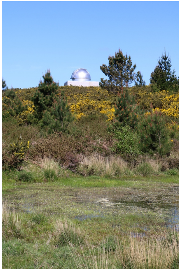
Lagoa do Campo da Poza e observatorio astronómico

En Carballedo chama a atención un cume de 774 m de altura coroado por unha torre de vixilancia de incendios, e achegarse a el é doado seguindo as indicacións do observatorio astronómico. Desde alí podemos gozar de panorámicas de 360º sobre os territorios de Cerdedo-Cotobade, os montes da redonda (Cando, Castelada, montes dos Cregos, Acibal...), os vales do Almofrei e do Lérez, Pontevedra e a ría, e parte das rías de Vigo e Arousa; e ao seu pé atopamos outros elementos que completan o conxunto e o interese da visita: a lagoa do Campo da Poza, unha pequena área de asolagamento estacional que na primavera se anima cos cantos das rás e as flores das oucas, e o observatorio astronómico da Asociación Medioambiental e Cultural “Canón de Pau”, inaugurado no 2011 (construído con apoio institucional en terreos cedidos pola Comunidade de Montes), impulsado e xestionado pola Asociación Astronómica Sirio, de Pontevedra, que realiza alí diversas actividades de observación e divulgación, os sábados á noitiña, con reserva previa e cando o tempo o permite.