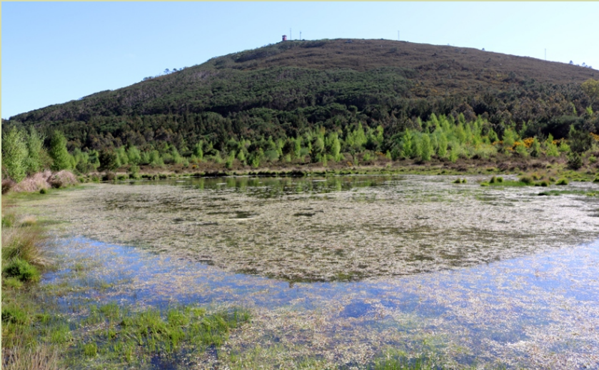
Lagoa do Campo da Poza