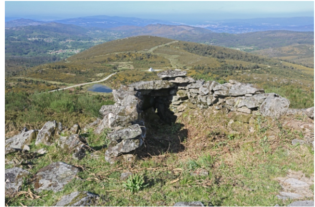
Refuxio no monte Coirego