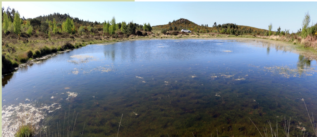
Lagoa do Campo da Poza