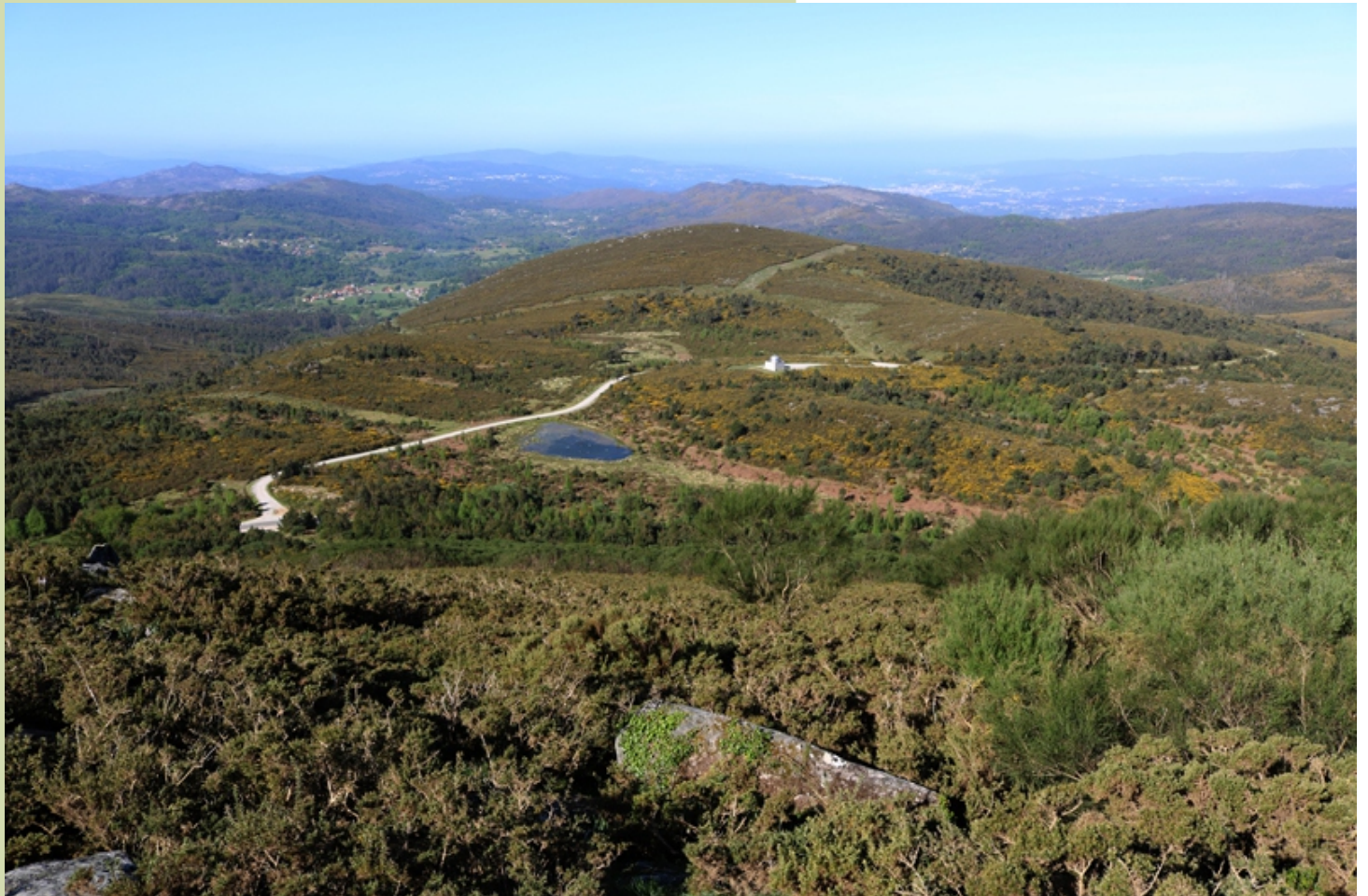
Vista desde o Monte Coirego